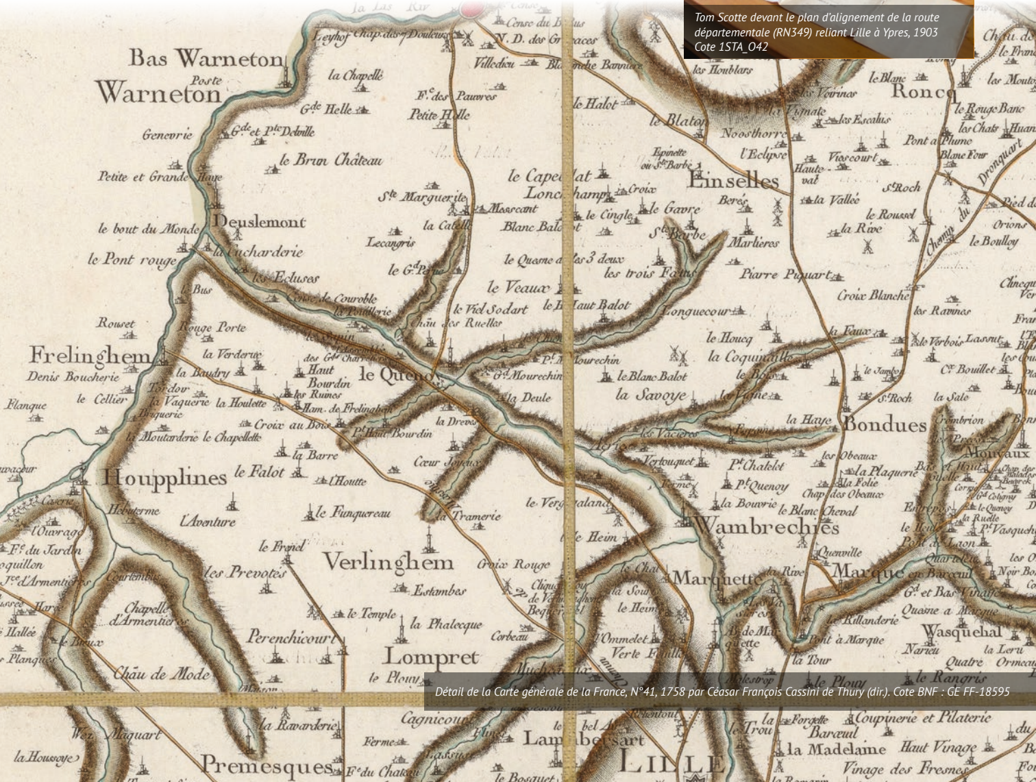
Détail de la Carte générale de la France, N°41, 1758 par César François Cassini de Thury (dir). Cote BNF : GE FF-18595